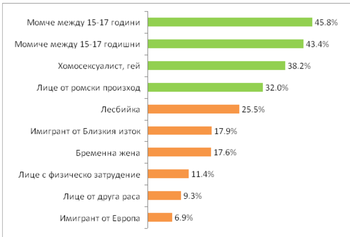
Фиг.1. "Представете си, че управлявате магазин и искате да назначите продавачи. Явяват се много кандидати, но можете да назначите само трима. Всички те отговарят на обявените от Вас условия. Кои трима от изброените бихте назначили и кои не бихте назначили?" – отговорили НЕ БИХ НАЗНАЧИЛ.

обявените от Вас условия. Кои трима от изброените бихте назначили и кои не бихте назначили? ". Резултатите от едномерните разпределения показват следния резултат: